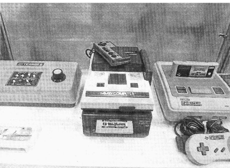
Son las primeras consolas de juego portátiles, a años luz de la PSP.

La Atari fue la primera consola que llegó a los hogares españoles en 1983, aunque su precio rozaba los 300 euros