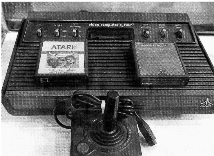
La mítica Atari con sus cartuchos para los juegos.

Aun así, los gráficos y los colores siguen dejando mucho que desear y las salas recreativas siguen oponiendo una fuerte resistencia a la dura competencia. "Es que algunas consolas eran un verdadero churro